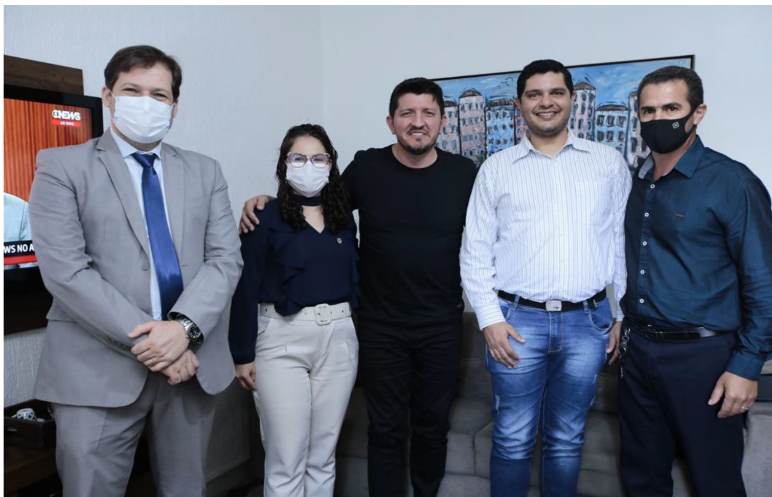
Reunião com o Deputado Federal Glaustin da Fokus